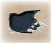
青塚古墳を見守る会 青塚古墳清掃活動