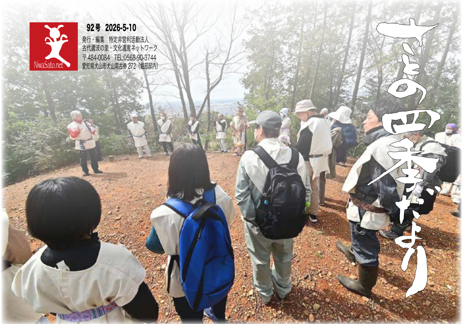
2026.3.20 東之宮古墳・土あげ祭