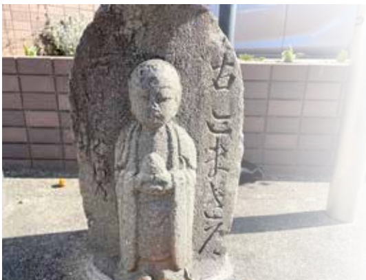
岩倉街道。次回で終着美濃路との追分周辺予定..岩倉街道冊子編集中心ワ里booklet年度内